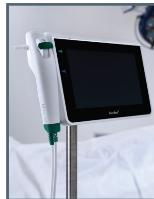
Ambu® aScope™ 4 Broncho Regular und Ambu® aView™