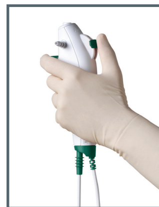
Das ergonomische und leichte Handstück bietet optimalen Halt und Griffkomfort