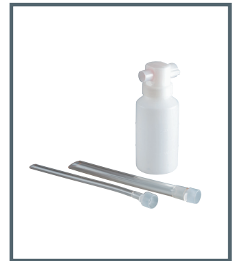
Einwegbehälter und Absaugkatheter