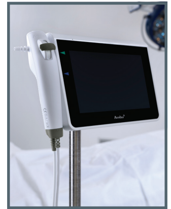
Ambu® aScope™ 4 Broncho Slim und Ambu® aView™