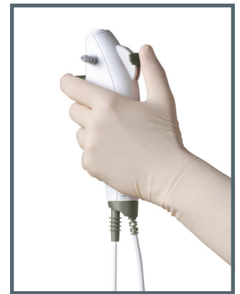
Das ergonomische und leichte Handstück bietet optimalen Halt und Griffkomfort