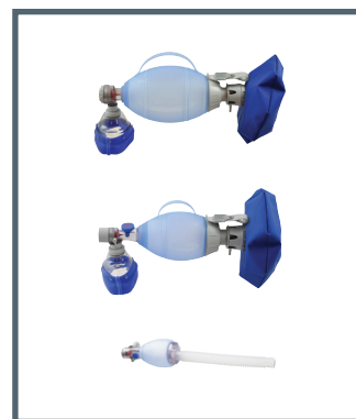
Ambu Transparente Silikon-Gesichtsmaske und Ambu Oval Plus Silikon-Beatmungsbeutel