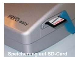
Speicherung auf SD-Card