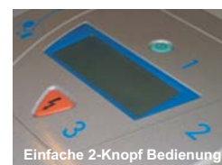
Einfache 2-Knopf Bedienung