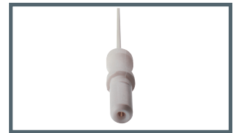
K = 1,5 mm Sicherheitsanschluss