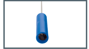
A = 4 mm Bananenstecker