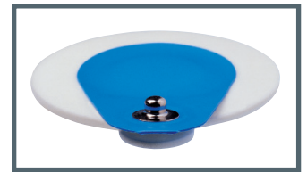
S = Druckknopf