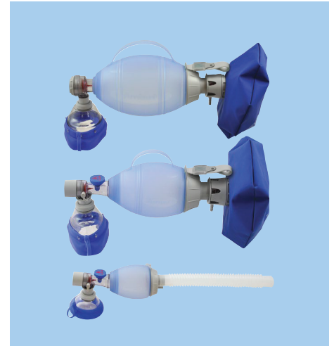
Ambu® Transparente Silikon-Gesichtsmaske angeschlossen an den Ambu Oval Plus Beatmungsbeuteln