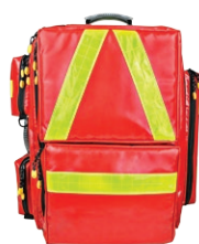
HERZmed WaterStop Notfallrucksack PROFI