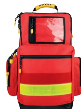
HERZmed Notfallrucksack YELLOW Large