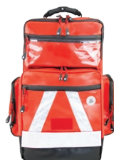
HERZmed WaterStop Notfallrucksack PRO