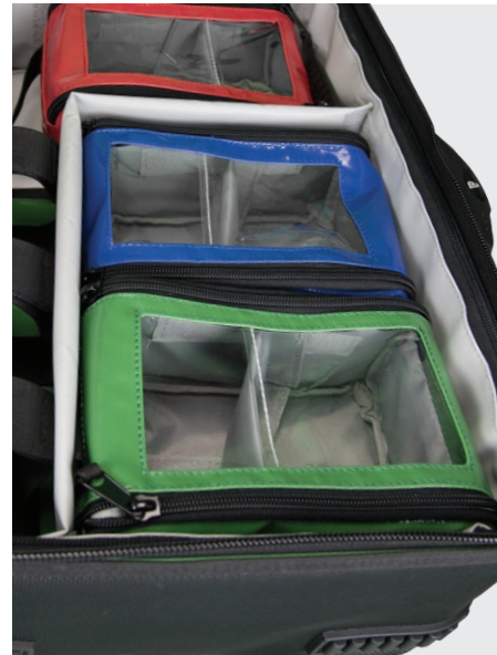
Modultasche S in X1 Notfallrucksack