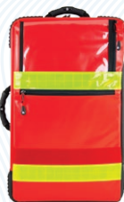
HERZmed PREMIUM Notfallrucksack X1