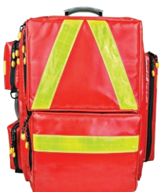
HERZmed WaterStop Notfallrucksack PROFI