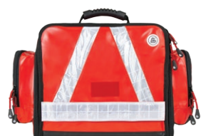
HERZmed WaterStop Notfalltasche FLEX