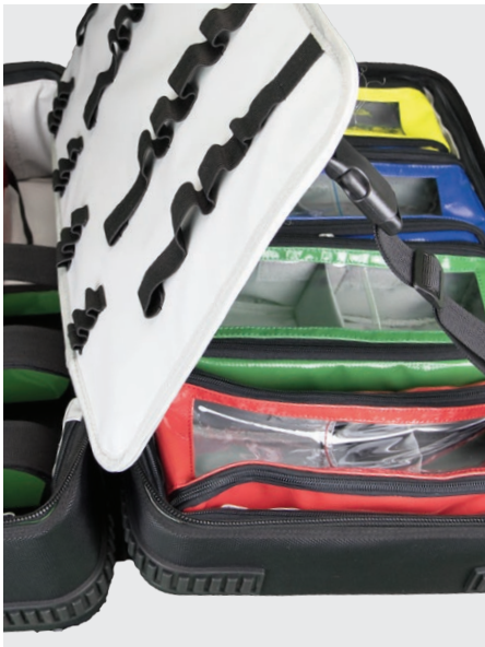
Modultasche L in X1 Notfallrucksack