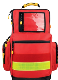
HERZmed Notfallrucksack YELLOW Large