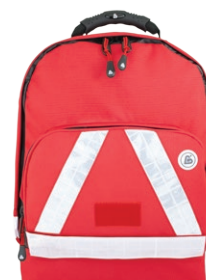
HERZmed WaterStop Notfallrucksack SMALL