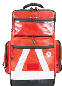
HERZmed WaterStop Notfallrucksack PRO