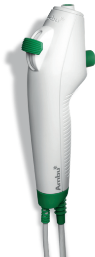
Ambu aScope 4 Broncho Regular 5,0 / 2,2 Biegewinkel: 180°/180°