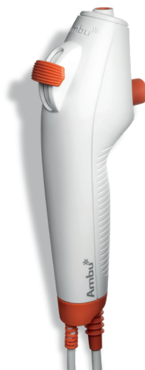
Ambu aScope 4 Broncho Large 5,8 / 2,8 Biegewinkel: 180°/160°