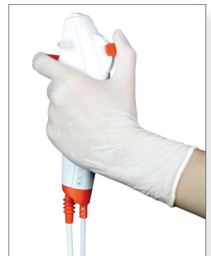
Das ergonomische und leichte Handstück bietet optimalen Halt und Griffkomfort