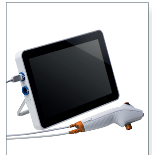
Ambu aScope 4 Broncho Large und Ambu aView 2 Advance